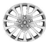
Колпаки штампованных стальных дисков 16" MIAMI