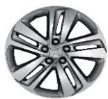
Литые алюминиевые диски 17" CURVE